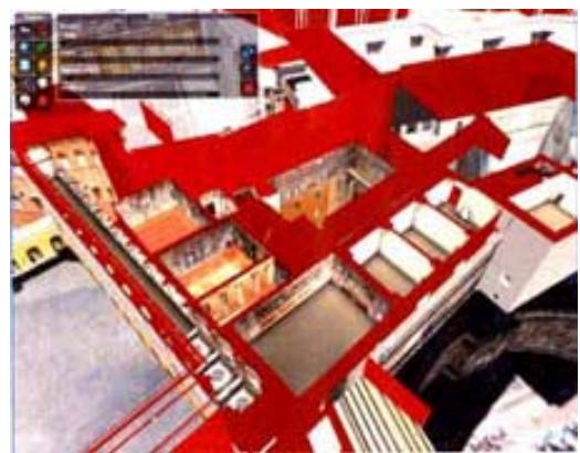
Città del Vaticano, rilievo laser scanner a nuvola di punti e modello tridimensionale georeferenziato per il progetto di catalogazione.