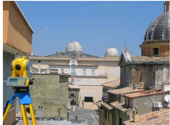
Castel Gandolfo, Chiesa di San Tommaso, rilievo con stazione totale dei prospetti esterni (Università degli Studi Roma Tre, DIPSA- Direzione dei Musei Vaticani, Ufficio di Sovrintendenza).

Il rilievo dell'architettura costituisce anche un documento importantissimo per il censimento e la catalogazione dei beni architettonici. L'ufficio di Sovrintendenza sta sviluppando un progetto pilota in tal senso; dopo una prima fase di impostazione del lavoro, di studio storico e rilievo georeferenziato eseguito a mezzo di laser scanner su alcuni ambienti dei Palazzi Apostolici e del Polo Museale, è stato elaborato un modello tridimensionale successivamente interfacciato con un data base ed una piattaforma GIS. Del progetto fa parte la redazione di schede di catalogo, su modello di quelle dell'ICCD.